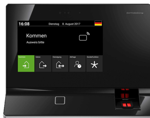
dormakaba Terminal 97 00