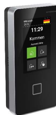
dormakaba Terminal 96 00